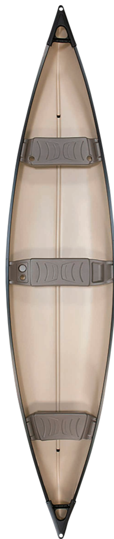
ペリカン/ ペリカン15.5

海や湖でのパドリングはもちろん、カヤックフィッシングなど幅広く活躍してくれるシートオントップカヤック。後部ラゲッジスペースには、クーラーバッグの積載が可能でツーリングに最適だ