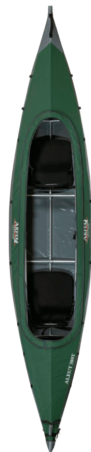
アルフェック/ アリユート 380T

コンパクトになるインフレーター、開放的なシートオントップもラインナップ。膨大な積載量を有するカナディアンカヌーならば、のんびりと漕ぎ湖や、大河でのツーリングにマッチする。