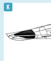
アルフェック/ フローテーションバッグM

¥6,380 / ◎モンベル 沈没をしたときの艇内に入る水を最小限に抑え、砂や小石などが入り込むのを防いでくれる