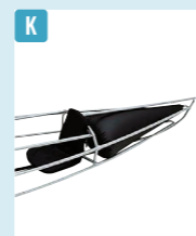
アルフェック/ フローテーションバッグLL

フロント用 ¥3,080 / ◎モンベル 荷物を積み込まないで漕ぎ出す際、万が一にひっくり返ってしまったときに備える浮力体がこちら