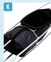
アルフェック/ シーソックスモール

エルズミア530 ¥66,000 / ◎モンベル シーカヤックで直進性を高めるためのラダーセット。方角を操作するフットプレイスなども付属