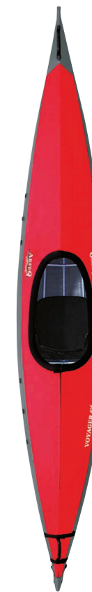
アルフェック/ ボイジャー415

最大積載量200kgを誇る1人乗り用のフォールディングシーカヤック。最大幅が61cmと細身で、リジッドカヤックに迫る高速性能と航海能力を備える同ブランドのフラッグシップモデルだ