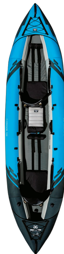
アクアグライド/ チヌーク120

扱いが容易なポリエチレン性で、安定感と耐久性に優れたカナディアンカヌー。最大で大人3名が乗ることができ、穏やかな河川や湖でのファミリーツーリングに最適だ