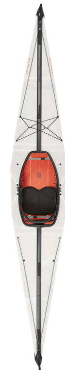
オルカヤック/ ベイST

北米の海洋先住民が生み出したものを源流とするシーカヤックをはじめ、リバーツーリングにも対応するモデルを集めた。フォールディングカヤックは、公共交通機関を利用することもできる。