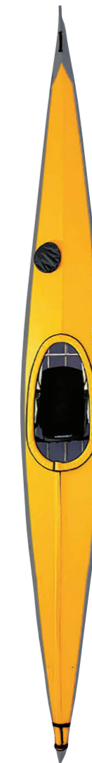
アルフェック/ エルズミア 530

2〜3泊程度のツアーに対応するリジッドシーカヤック。ポリエチレン製で、比較的入手しやすい価格も魅力。積載量が少ないときは機動性に優れ、満載時には安定感を生み出す