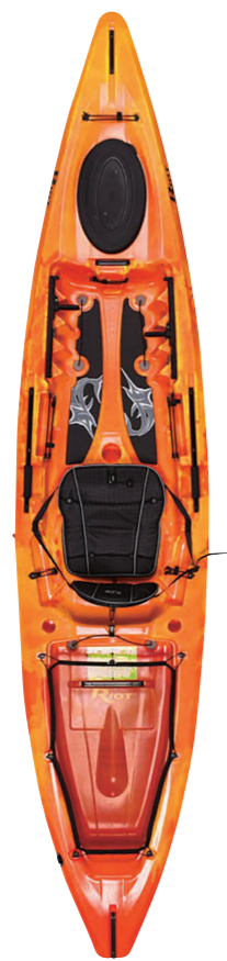
ライオット カヤックス/ マーリン12

水辺の散策やバードウォッチング、フィッシングなどに最適なフォールディングカヤック。1人でも乗れ、シート位置を変えてオープンデッキカヌーのように2人乗りすることも可能