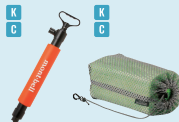
モンベル/ ビルジポンプ

¥1,980 / ◎モンベル 沈没や船底に穴が空くなど、大量の浸水があったときは効率的なビルジポンプで排水を行いたい